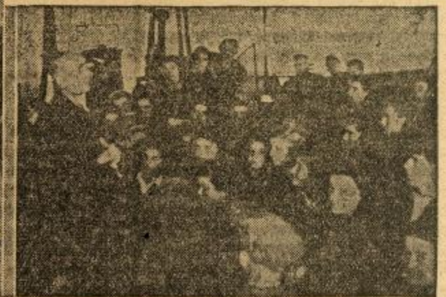
1. У БИВШОЈ ТВОРНИЦИ »БАТЕ« РАДЕ СЕ САДА ЦИПЕЛЕ ЗА НАШУ ВОЈСКУ. 2. ЧЛАНОВИ ОМЛАДИНСКЕ РАДНЕ БРИГАДЕ ЧИСТЕ РУШЕВИНЕ НА ТЕРАЗИЈАМА. 3. СТАРИ РАДНИК ГОВОРИ НА САСТАНКУ У ФАБРИЦИ, ГДЕ СЕ ОМЛАДИНА ДОГОВАРА КОЛИКО ЋЕ САТИ НА ДАНРАДИТИ ЗА СВОЈУ ВОЈСКУ.

По ослобођењу Београда омладина је по свим реонима створила радне јединице, које су већ до сада учиниле много на нормализовању живота у Београду.