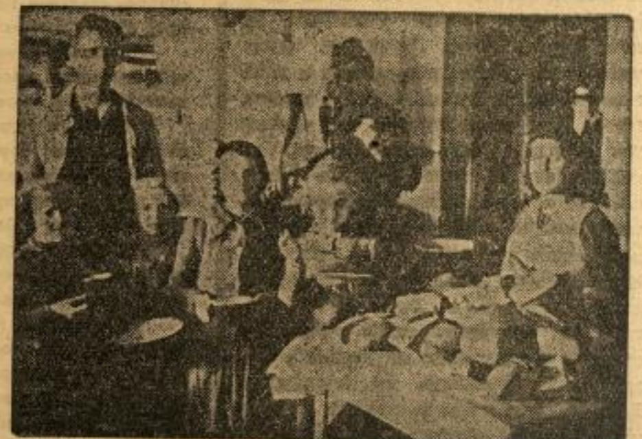
5. ПИОНИРИ ЧЕКАЈУ НА РУЧАК У КУХИЊИ, КОЈУ ЈЕ ОРГАНИЗОВАЛА ОМЛАДИНА IV РЕОНА.

У Београду ће се 5 новембра такође одржати избори за омладинске делегате у свим реонима града.