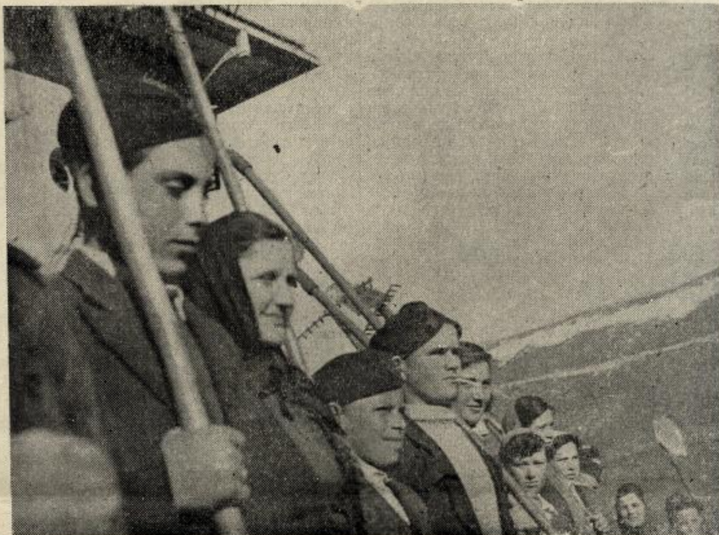
Jedna desetina drvarske omladinske radne brigade