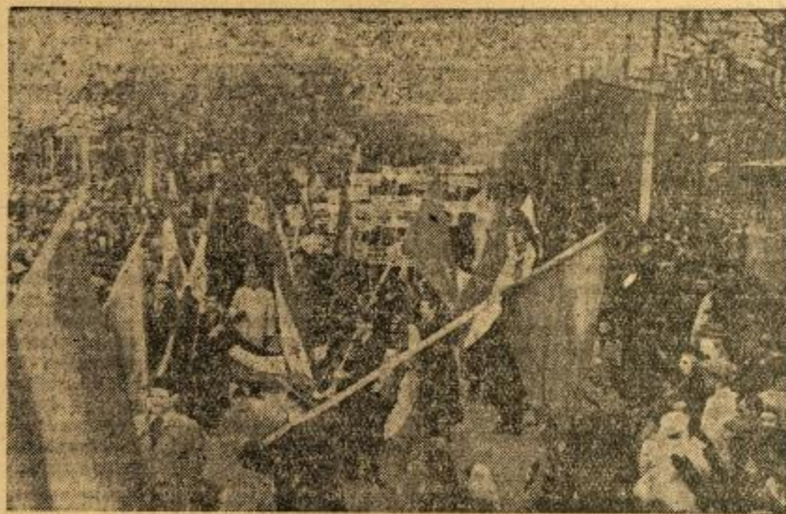
Са прославе 7 октобра: У бескрајним поворкама, Београђани крећу ка Славији где је одржан митинг.

На крају је истулно и књижевник Радован Зоговић.