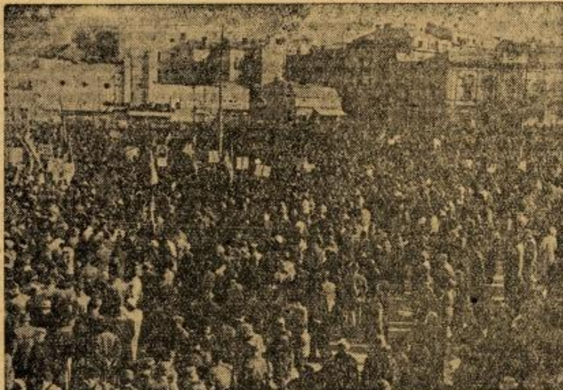
Са прославе 7 октобра: Хиљаде и хиљаде људи скупили су се на великом тргу Славије.

Још никад Београд није могао и није смео да слободно слави велике празнике читавог напредног човечанства. Ове године су борци наше славне Народно-ослободилачке војске и братске Црвене армије, улажући своје заједничке жртве, омогућили Београду да први пут на својим улицама слободно слави велики дан, дан рођења Совјетског Савеза, годишњицу Октобарске револуције.