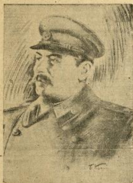
Јосиф Висарионович Стаљин

Прелазећи на питање учвршћења и проширења фронта антихитлеровске коалиције као и питање мира и послератне безбедности, претседник Државног комитета одбране, маршал Стаљин, између осталог, рекао је: