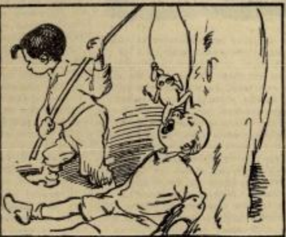
Гле, из уста, брз кб јелен излетео жабац зелен. Осетно из далека да на њега муха чека.