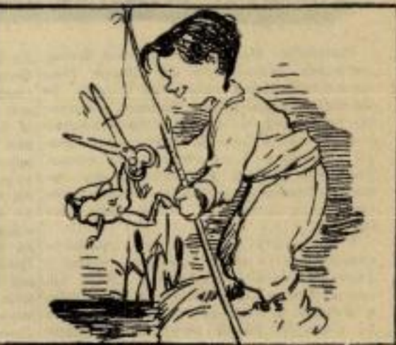
Пустише га на слободу да кретеће жабљем роду. Истина је ово жива, жабац и сад водом пливва.