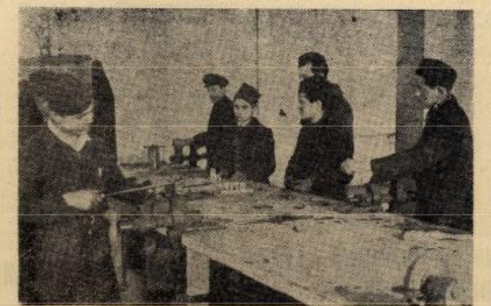
Шегрти у раднишћу свога дома у Краљевићеву

Шегртски дом у Београду постојао је и пре рата. Био је у приватним рукама. Подигло га је друштво „Приредник“ 1930. године у Крунској улици.