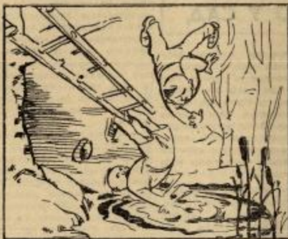
А те лестве, старе, труле, под тежком препуниле, и мангули чисти, белн, посред баре улотели.