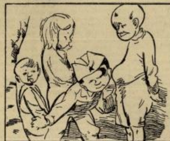
Као доктор слуша Ђира по желуцу шта корзира и у себи план већ прави друге беде да избави.