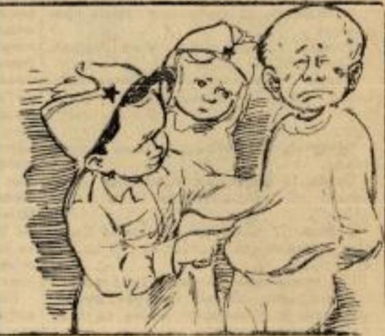
Кад мангуп на ноге стао, види: нешто одебљао. Нечастава нека сила у трбух се њему скрила.