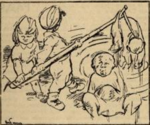
Пали су на место дубље, па личе на мокро рубље. Ђира, Мира, муче муку — из воде их мотком вуку.