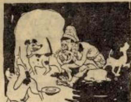
А с Фрицем ни пси геће да једу!