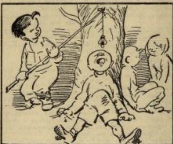
Помоћи ће њему муза да истера тога духа. Мангуп знаћ. Над устима Ђира мувом-манцем цима.