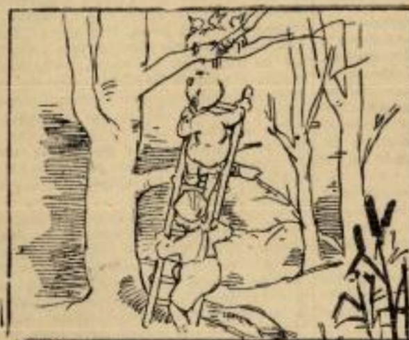
Два мангула, сто кане, птиче гнездо сјинут с гране, па уз лестве сад се клате птиће живе да узвато.