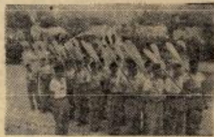
Далматинска омладина изводи венбе са веслица

У одбор „Гусара“ и „Јадрана“ ушли су многи познати споратски радници и активни споратисти.