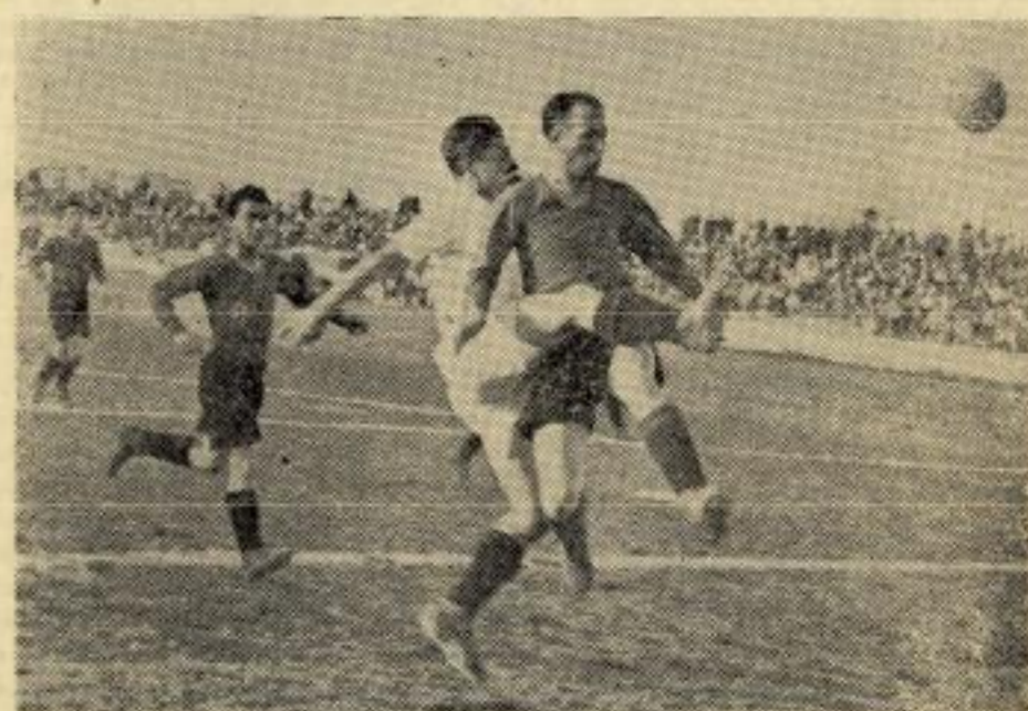
Момент са утакмице између Софије и београдске омладинске репрезентације