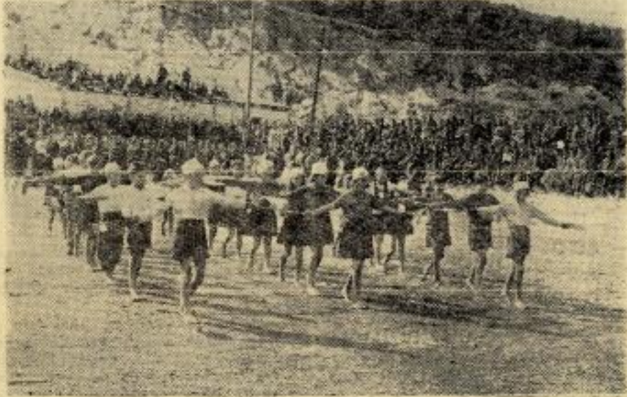
Далматински пионири вежбају

зације могле да постану терет школи и суларник ауторитету учитеља. Данас, када су намјере пионирске организације познате, међу наставницима свих школа овај рад стиче пријатеље. Наше новинаство показује велико разумевање за овај облик васпитног рада. Што је најважније сам маршал Југославије показао је јасно колико пажње посвећује најмлађим у држави, колику важност полаже на што бољи рад пионирске организације.