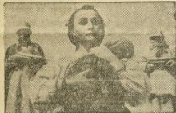
Сцена из филма „Дуга“

С великим успехом се приказују следећи руски филмови: Љермонтов, биографија живота борбе и смрти великог руског песника, „Стаљинград“, филмска епопеја огромне победе Црвене армије над завојевачима и „Дуга“. У „Дуги“ је дат живот у једном руском селу за време окупације, страдање сељака који помажу партизане. Режијер Парештајн, главну улогу има Алисова, продукција Москва.