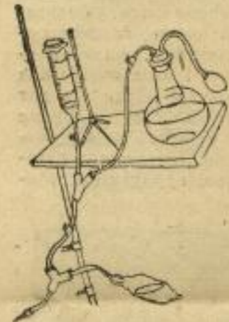
Апарат за трансфузију крви

Трансфузија крви је старог датума. Још крајем Средњег и почетком Новог века људи су покушавали да врше трансфузију животињске крви. Међутим та је метода напуштена. Дуго се после у том правцу није ништа радило. Већа примена је покушана у Аустријско-италијанском рату 1866 године. У многим случајевима је успех био ванредан, док су олет и многи рањеници остајали иртваи, још на операционом столу. Лекари нису успевали да објасне у чему је била грешка и због тога је трансфузија крви, као важан, посебни подухват у медицини, била забрањена. Тек је носилац Нобелове награде проф. Ландштајнер пронашао у првим годинама XX-ог века, да се људи разликују по крви на четири групе: О, А, Б, и АВ групе. Међутим тај проналазак нашао је ширу примену. Истом за читаву деценију касније. Он је искоришћен за трансфузију крви на том принципу, да се приликом трансфузије даје крв исте групе истој групи. Захваљујући овом открићу, данас се врши трансфузија у огромном броју случајева. То се радило у време мира, а поготово у овом рату. Трансфузија крви се даје из два разлога. Први је: код многих загађених рана и других оболења, трансфузија је једно од најпознатих средстава за лечење. Други је од врло велике важности сада у рату, да се изоднади изгубљена крв и да се поврати живот рање-