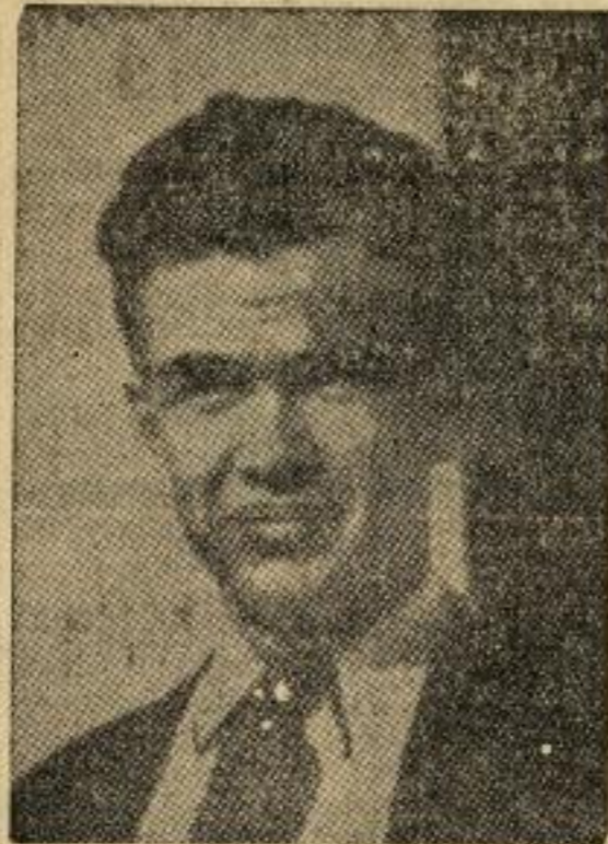
Народни херој Иво-Лола Рибар

27 новембра, у дворани Коларчеве задужбине у Београду Централни одбор УСАОЈ-а приредио је свечану комеморацију поводом годишњице смрти Ивана-Лоле Рибара.