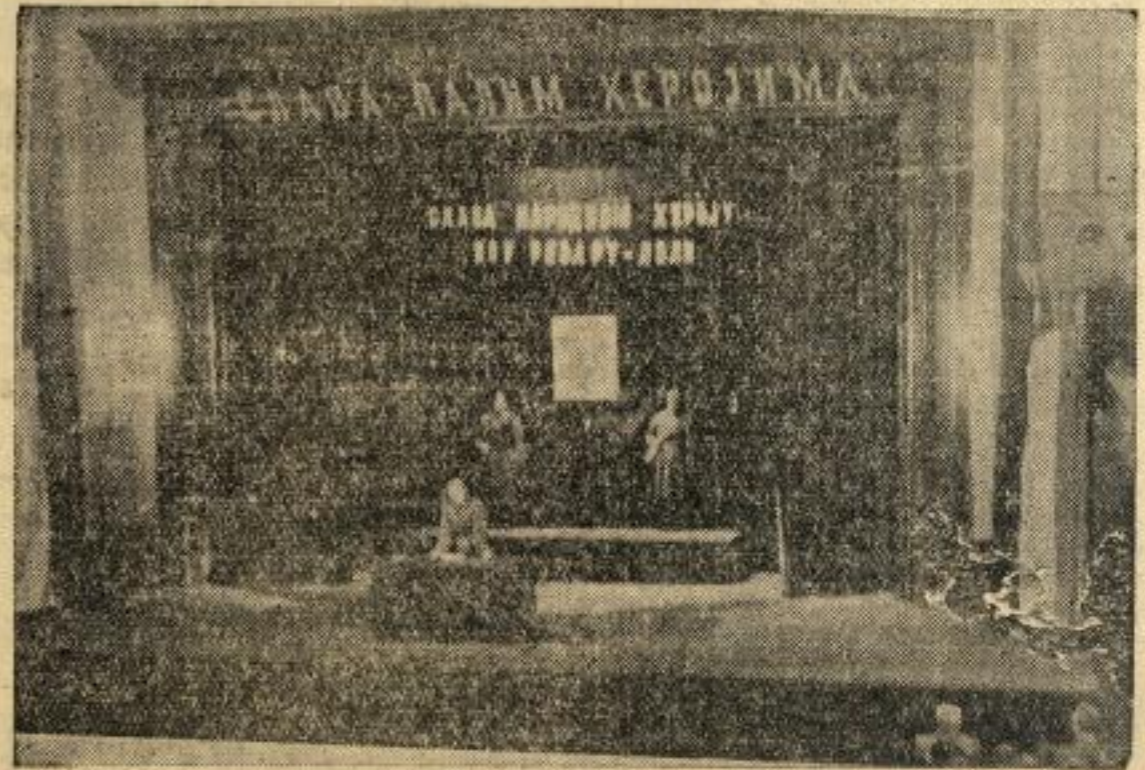
Позорица Коларчевог универзитета за време свечане комеморације